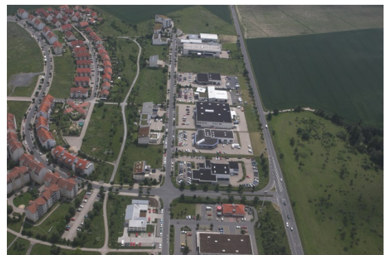
Standort mit angenehmem Umfeld