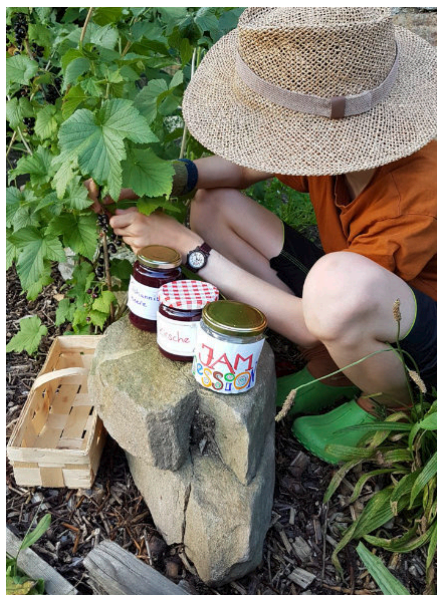
Früchte aus dem Garten für leckere Marmeladen

Eine Veranstaltung der Euroregion Elbe/Labe in Kooperation mit Pirna 800, der