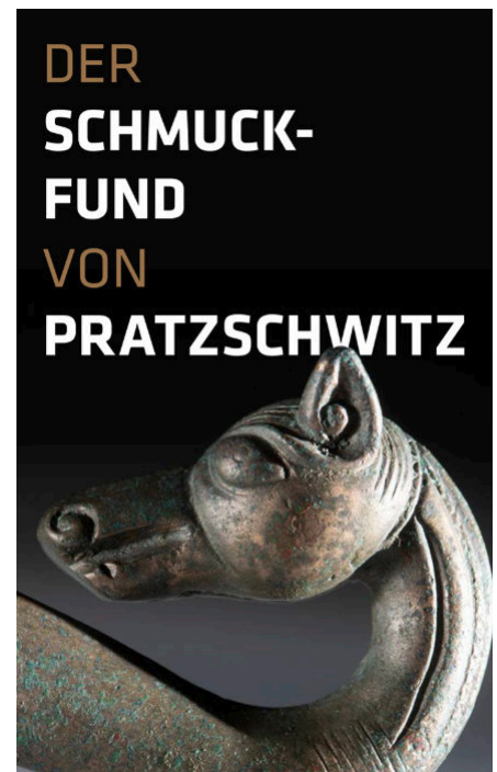
„Der Schmuckfund von Pratzschwitz“ (Plakat: PR)

In einem kleinen, vergrabenen Gefäß befanden sich verschiedene Schmuckstücke, wie man diese in solcher Zusammenstellung und Qualität in Sachsen noch nie gesehen hatte: Eine aufwändig verzierte Gewandschließe aus Bronze – eine sogenannte Maskenfibel, zwei gut erhaltene bronzene Gewandschließen – sogenannte Vogelkopffibeln, ein Kettencollier aus Bronze – bestehend aus einem halbkreisförmigen, verzierten Reif und einer daran fixierten fünfstrangigen Kette sowie 485 Perlen aus Bernstein und Glas einer Halskette.