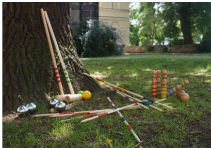
Bibliothek der Dinge

Lust auf einen Spielnachmittag im Freien? Die dazu passenden Outdoor-Spiele gibt es demnächst in der StadtBibliothek Pirna. In der seit Juni neu eingerichteten „Bibliothek der Dinge“ finden sich neben Tiptoi-Stiften, Tonieboxen und Switch-Konsolen bald auch Spieleklassiker wie Boule, Krocket, Mikado und Wikingerschach oder neue Erfindungen wie STAKK, Spikeball oder Tulaloop. Das Team der StadtBibliothek Pirna hofft, das Interesse bei Klein und Groß geweckt zu haben und steht für Rückfragen gern zur Verfügung.