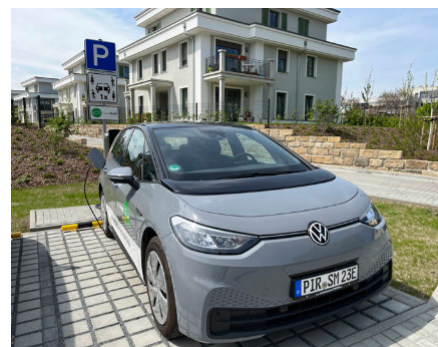
Öffentlicher Ladepunkt an den Sandsteingärten

Die Stadtwerke Pirna beraten und unterstützen Bürger und Unternehmen gern bei der Errichtung eigener Wallboxen und Ladepunkte. Weitere Informationen dazu sind auf der Website www.stadtwerke-pirna.de unter der Rubrik „Strom“ und „Elektromobilität“ zu finden. Der Kundenservice ist telefonisch unter 0800 589-1403 für Sie da.