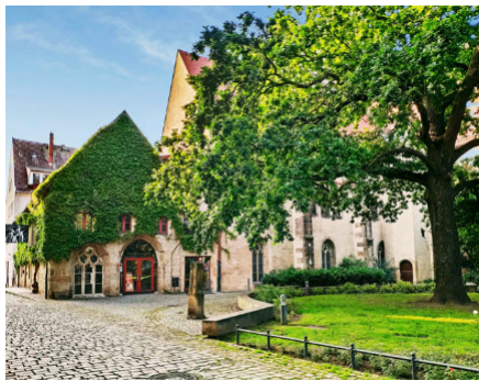
Klosterhof Pirna

Archäologie, moderne Methoden in der Grabungsdokumentation, Techniken der Fundrestaurierung oder Ausstellungen des Archäologischen Landesmuseums in Chemnitz informiert. Kinder können bei „Ausgrabungen“ auf Entdeckungstour gehen und am Restaurierungstisch zerbrochene Gefäße wieder zusammensetzen. Alle Themen werden von den Fachleuten des Landesamts für Archäologie Sachsen anschaulich erläutert, Fragen sind ausdrücklich erwünscht. Am Stadtfest-Sonntag übernehmen die Museen der Region den Klosterhof und stellen beim „Museumsmarkt“ aktuelle Forschungs- und Ausstellungsthemen vor.