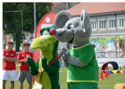
Maskottchen Dino Bruno und Flizzy-Maus

Sonne, Sport und Spaß in Pirna: Zum zweiten Mal in diesem Jahr veranstaltete der Kreissportbund Sächsische Schweiz – Osterzgebirge Anfang Mai sein Vorschulkindersportfest im Landkreis. Rund 320 Mädchen und Jungen aus 25 Kindertageseinrichtungen in der Region folgten der Einladung nach Pirna. Auf dem Sportplatz des ESV Lok an der Einsteinstraße probierten sich die Vorschulkinder an mehreren Stationen in verschiedenen Disziplinen aus. Die fleißigen Helfer vom Sport-Promotion-Team und Mitarbeiter des KSB standen den jungen Sport-Assen zur Seite. Für die absolvierten Stationen gab es dann das Sächsische Kindersportabzeichen „Flizzy“. Außerdem konnten die Steppkes mit Dino Bruno und der Flizzy-Maus tanzen und zwischendurch auch wieder rote Ballons in den Himmel steigen lassen. Zum Abschluss folgt das Staffellauf-Finale und bei der Siegerehrung gab es Pokale, Medaillen und kleine Präsente für die künftigen Schulanfänger.