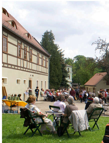
Picknick am Lohengrinhaus