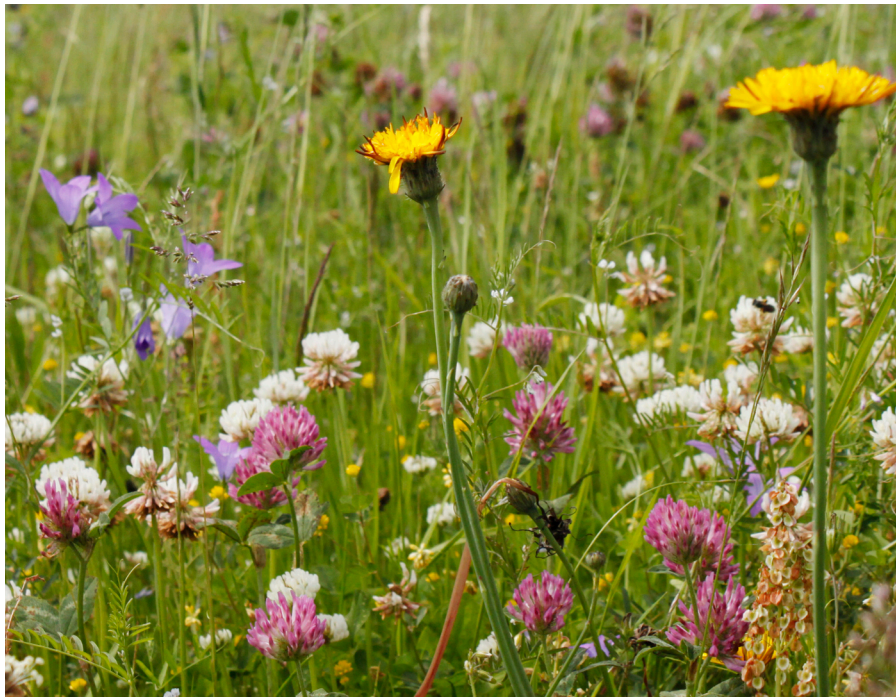
Landschaftspflegeverband Sächsische Schweiz – Osterzgebirge e.V.