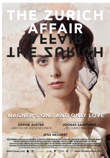
Filmplakat „The Zurich Affair (Die Zürich-Affäre)“

An gleicher Stelle folgt am 20. Mai um 19:00 Uhr, die Weltpremiere der deutschen Synchronfassung des Kinofilms „The Zurich Affair (Die Zürich-Affäre)“ – eine Liebesgeschichte in der Schweiz, inszeniert von Regisseur Jens Neubert. Die