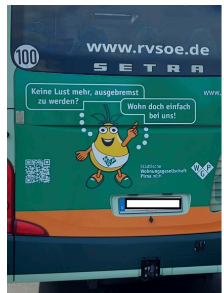
Busse mit Werbebotschaften der WGP sind im Landkreis unterwegs