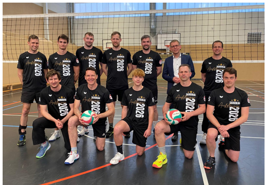
Bürgermeister Markus Drebler würdigt die erfolgreiche Volleyballmannschaft des VfL Pirna-Copitz beim Besuch vor Ort

dermittel der Sächsischen Aufbaubank einwerben, um die Wärmeversorgung des Vereinsgebäudes auf eine klimafreundliche Wärmepumpenlösung umzustellen.