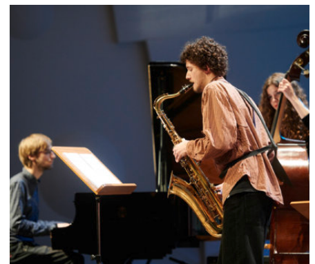
Band Summit