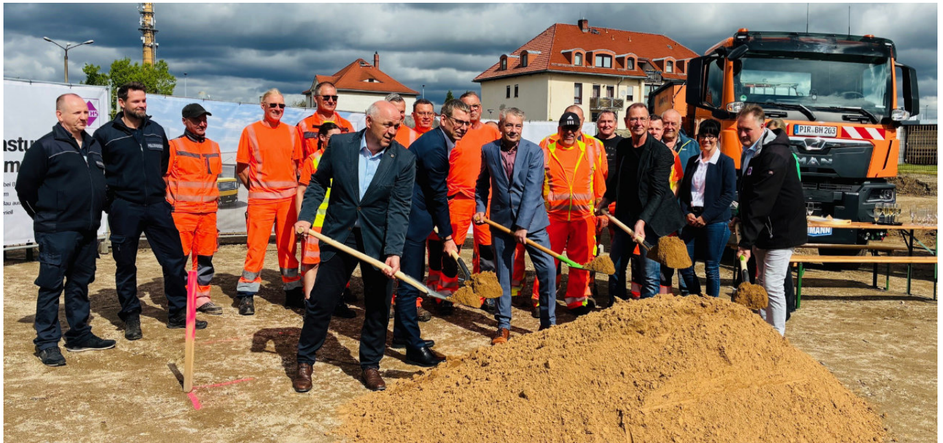
Hochmotiviert und voller Vorfreude: die Mitarbeiter des Bauhofes und des Ordnungsamtes mit den Stadtobehauptern und der Baufirma Fuchs-Bau Ost beim symbolischen Spatenstich für ihr neues Domizil