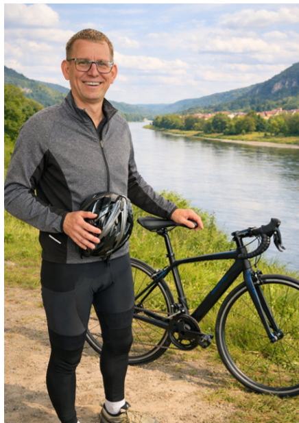
Bürgermeister Markus Dreßler lädt zur Fahrradtour ein

Nebenbei können auf der Tour natürlich auch Kilometer für das 10. Stadtradeln gesammelt werden. Wer noch nicht registriert ist, kann dies online nachholen unter www.stadtradeln.de/pirna .