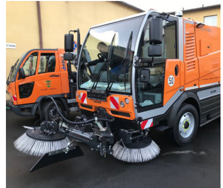
Straßenabschnitte kann die Kehrmaschine nur ordnungsgemäß reinigen, wenn die Halteverbote beachtet werden

Alle Informationen zu den jeweiligen Freisperrungen der Straßen sind auf der Internetseite der Stadt Pirna abrufbar. Zusätzlich liegen die Tourenpläne der Kehrmaschinen im Rathaus aus, die Bürgerinnen und Bürger kostenlos mitnehmen können.