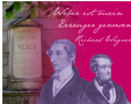
Weber-Wagner-Wiese 2026

Im Jahr des 240. Geburtstags des Komponisten Carl Maria von Weber wird am 7. Juni eine Weber-Wagner-Wiese auf dem Hof des Jagdschlusses Graupa gefeiert. Diese Veranstaltung findet in Kooperation mit dem Carl-Maria-von-Weber-Museum Dresden statt. Im Zentrum steht das Thema Wald und Natur als Orte, die sowohl in Carl Maria von Webers „Freischütz“ als auch im Werk von Richard Wagner eine wichtige Rolle spielen. Neben Bastelangeboten für Kinder gibt es die Möglichkeit, gemeinsam mit einem Schmied Kugeln zu gießen. Zwei Greifvogel-Shows sind anberaumt, aber auch eine Biedermeier-Modenschau im Schlosshof. Kulturell wird der Nachmittag abgerundet durch u. a. die Grundschule Graupa, den Richard-Wagner-Chor Graupa und die Opernklasse der Hochschule für Musik Dresden mit einer unterhaltsamen Kurzfassung von Wagners