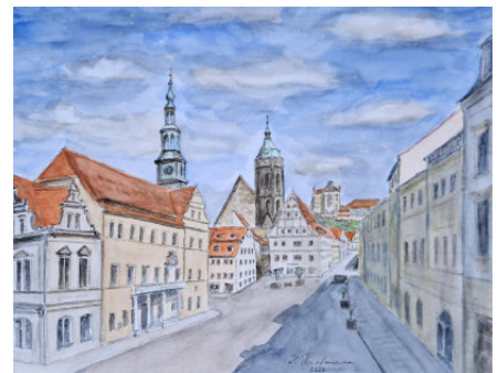
© Repro: Mal- und Zeichenzirkel/Pirna-Sonnenstein e.V.; Bild: Dieter Hartmann