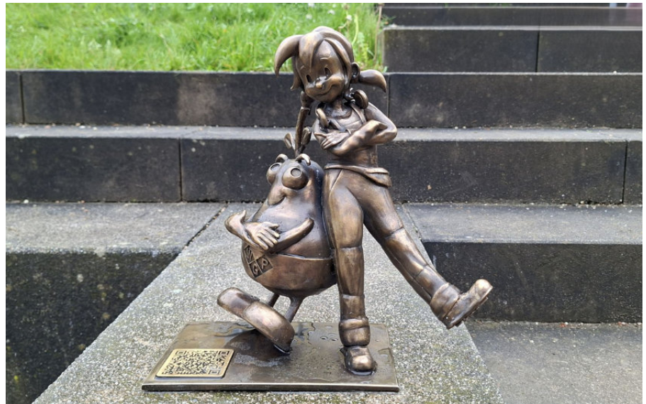
Pine Nummer 15: Pirnaer Knirps zielt den Sonnensteiner Birnenhof

Nähere Infos zu Stellenangeboten www.pirna.de/jobs