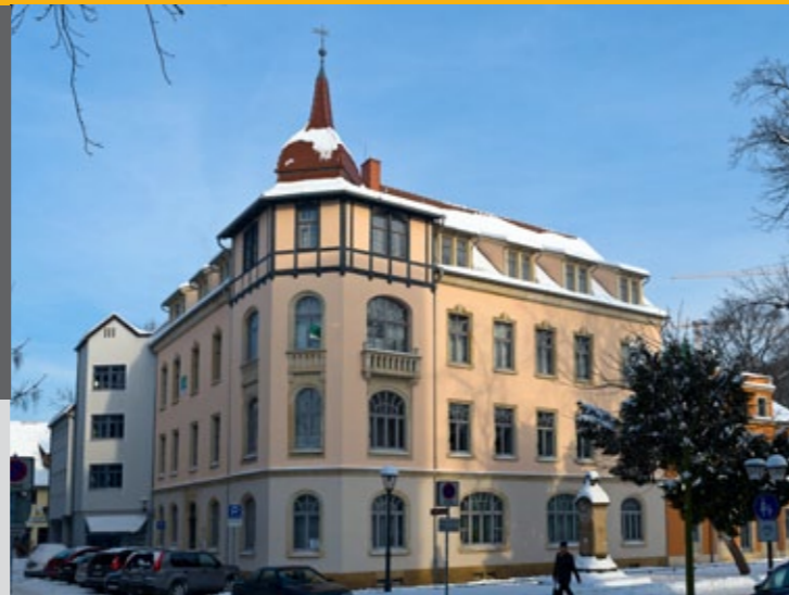
Unser Geschäftssitz in der Gerichtsstraße (1. OG)