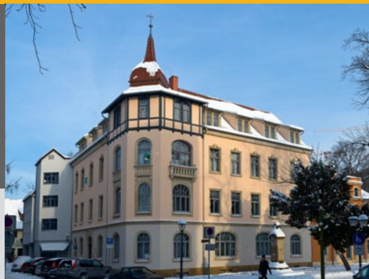
Unser Geschäftssitz in der Gerichtsstraße (1. OG)