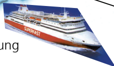
schnelle Fährverbindung Rostock - Helsinki