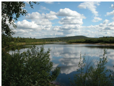
die Landschaft: traumhaft