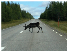
immer wieder: Rentiere

Finnland ist eine Republik und seit 1995 Mitglied der Europäischen Union. Das Land hat ca. 5,2 Mio. Einwohner, davon leben 550.000 in Helsinki. Offizielle Landessprachen sind Finnisch und Schwedisch, Minoritätensprache ist Samisch. Flächenmäßig ist Finnland das sechstgrößte Land in Europa, drei Viertel der Landschaft sind Waldflächen, besonderes Kennzeichen sind die genau 187 888 Seen. Jenseits des Polarkreises geht die Sonne im Sommer 73 Tage nicht unter, im Winter bleibt die Sonne 51 Tage lang hinter dem Horizont.