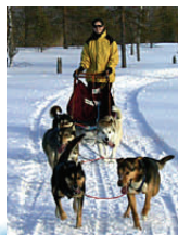
beste Fortbewegung im Winter