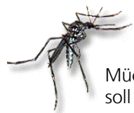
Mücken??? soll es angeblich geben ...