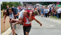
und noch mehr ... Frauentragen Handyweitwurf Schlammfußball

GLÖGGI Finnischer Glühwein 2 l Rotwein, 1 l schwarzer Johannisbeersaft, 150 g Zucker, 1 EL gemahlener Zimt, 1/2 EL Ingwer, 1 EL gemahlene Nelken, 1/2 Pfd. Rosinen, 1/4 l Wodka KIPPIS!