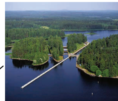
Varkaus - Partnerschaft zu Pirna seit 1961