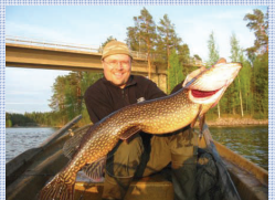
Angeln - mit Erfolg!