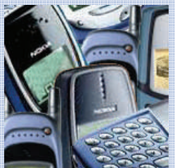
Wer kennt es nicht? NOKIA