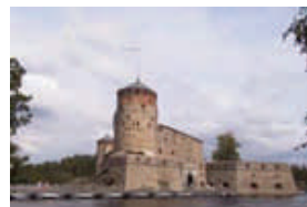
berühmt: Opernfest- spiele in Savonlinna