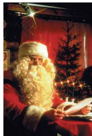
Rovaniemi: Weihnachtsmann, Polarkreis, Lordi u.v.m.

GLÖGGI Finnischer Glühwein 2 l Rotwein, 1 l schwarzer Johannisbeersaft, 150 g Zucker, 1 EL gemahlener Zimt, 1/2 EL Ingwer, 1 EL gemahlene Nelken, 1/2 Pfd. Rosinen, 1/4 l Wodka KIPPIS!