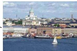
einzigartig: die Hauptstadt