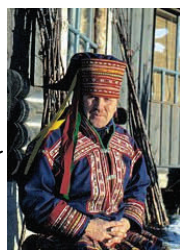
Bevölkerung Lapplands sind die Samen