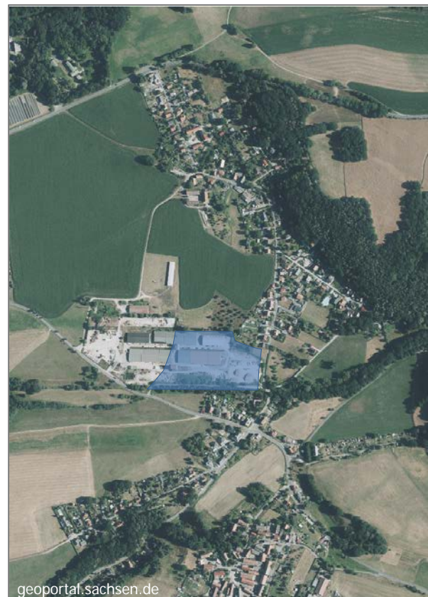
Lage im Ortsteil Zatzschke/Mockethal