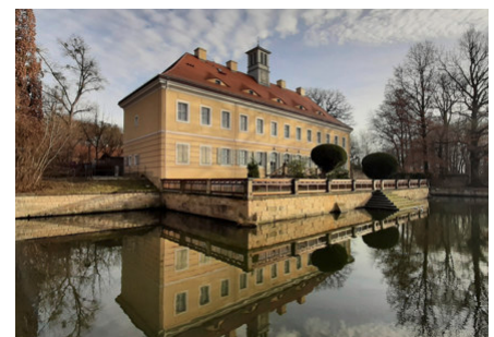
Das Jagdschloss Graupa ist Tagungsort der Gastgebersammlung