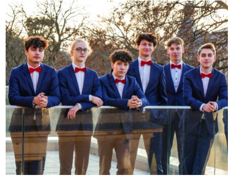
Das twentytwo-ensemble aus Dresden

Das Oktett verfügt über ein vielseitiges Repertoire, das A-cappella-Stücke unterschiedlichster Stile und Herkunft vereint. Neben der Pflege geistlicher Chormusik von Heinrich Schütz über Felix Mendelssohn Bartholdy bis hin zu zeitgenössischen Kompositionen wird auch weltliche und moderne Musik dargeboten. So erklingen Titel von den Wise Guys, den Comedian