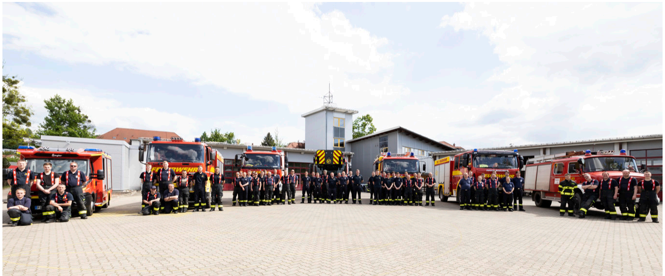
V.l.n.r.: OFW Neundorf, OFW Liebethal, OFW Copitz, Hauptfeuerwache, OFW Altstadt, OFW Graupa, OFW Birkwitz-Pratzschwitz