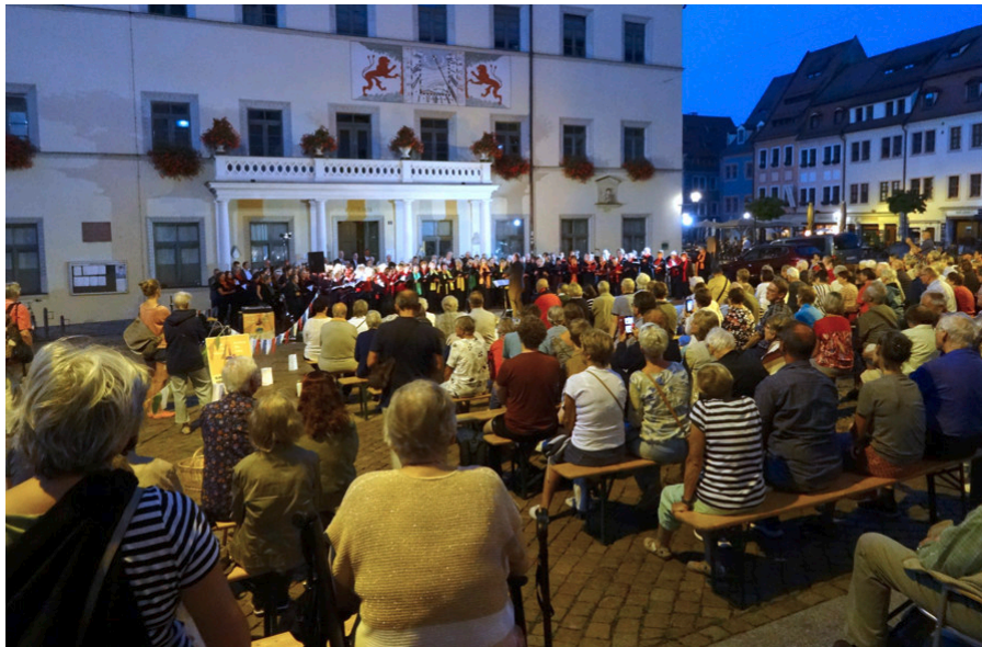
Chorkonzert auf dem Obermarkt