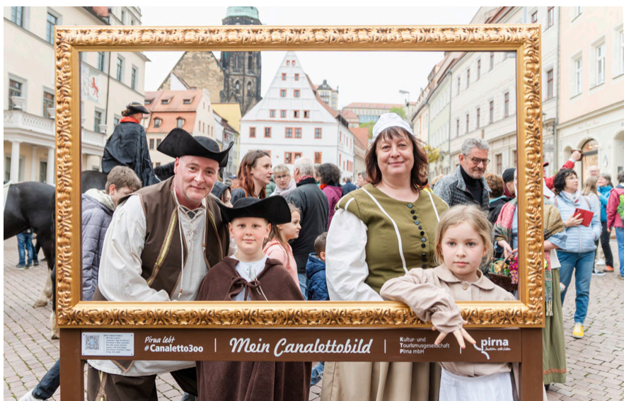
„Mein Canaletto-Bild“

Mit der „Großen Sonate für das Hammerklavier“ op. 106 sprengte Ludwig van Beethoven alle bis dahin geltenden Gattungsgrenzen. Das selten gespielte Spätwerk, das erst Jahrzehnte nach Beethovens Tod von Franz Liszt uraufgeführt wurde, wird bis heute von Pianisten wegen seiner technischen Schwierigkeiten und musikalischen Herausforderungen gleichermaßen gefürchtet wie geliebt.