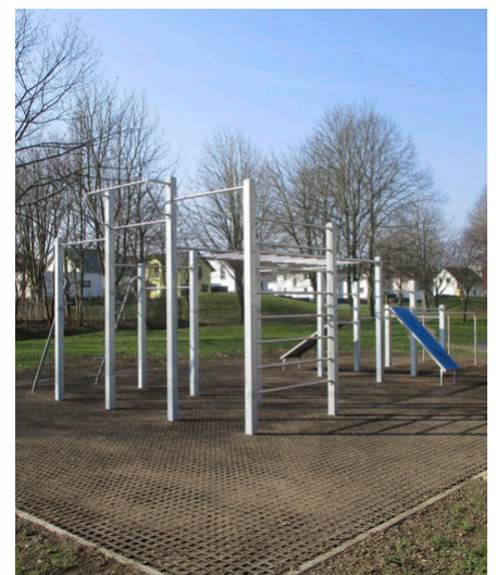
Großfitnessgerät zum Thema „Bewegung“ auf dem Erwachsenenspielplatz

Nun hat sich die WGP wieder dem Thema „Bewegung“ angenommen und den Fitnesspark um ein viertes, großes Gerät ergänzt. (WGP)