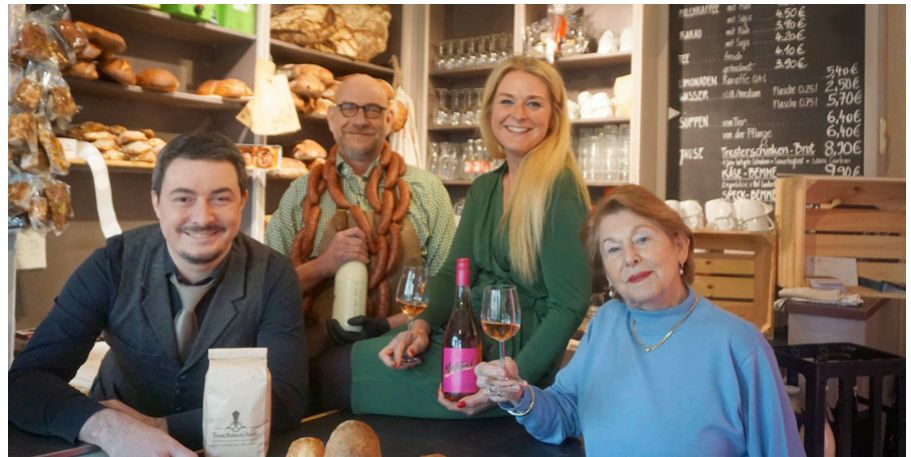
Das Team der kulinarischen Stadtführung