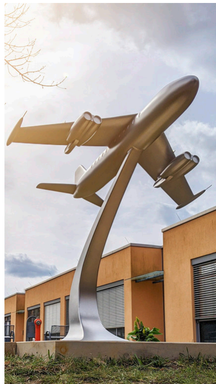
Ein originalgetreues Modell der „Baade 152“ erinnert an den Standort des ehemaligen Werkes VEB Entwicklungsbau Pirna. Hier wurde das Strahltriebwerk, bezeichnet als „Pirna 014“, entwickelt. Das Denkmal befindet sich vor dem Eingangsbereich des Helios Klinikums Pirna.

Pirnas Geschichte ist unverwechselbar verbunden mit der wirtschaftlichen Entwicklung dieser Stadt. Zu den maßgeblichen Industriezweigen zählten damals unter anderem die Kunstseide im Westen der Stadt, die Glaswerkstätten in Copitz aber auch das Strömungsmaschinenwerk auf dem Sonnenstein. An allen Standorten erinnert nun ein Gedenkort an die ehemaligen Wirtschaftsbetriebe.