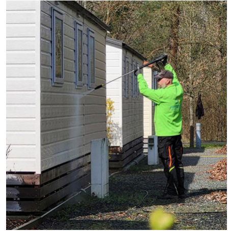
Frühjahrsputz auf dem Gelände des Campingplatzes