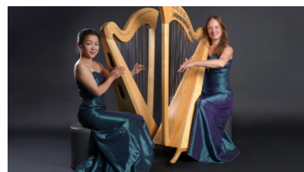
Harfenduo Dresden