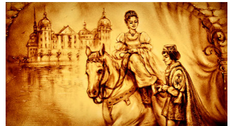
Drei Haselnüsse für Aschenbrödel