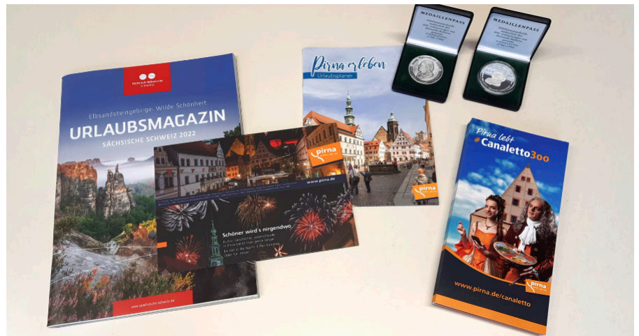
Canaletto-Festjahr 2022