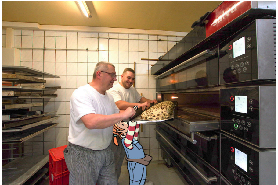
... und jetzt alle zuuuuugleich! Puhhhh ... Alleine krieg ich höchstens die Rosinen hochgehoben. Ohne den Stollenteig. (Foto: DRAUSSENZEIT, Illustration: Axel Bierwolf)

Pines Notiz-Blog ist unter www.pine-pirna.de rund um die Uhr erreichbar und lädt mit mittlerweile fast 40 Beiträgen zu den un-