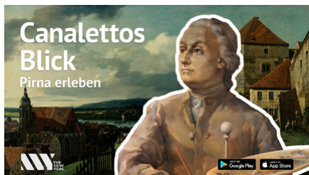
Canalettos Blick – Pirna erleben

Einen geführten Rundgang durch Pirna mit kunstgeschichtlichem Schwerpunkt gibt es jetzt auch für das Smartphone: Die neue App „Canalettos Blick – Pirna erleben“ nimmt Interessierte mit auf eine magische Zeitreise. Stadtführer ist kein geringerer als Bernardo Bellotto, genannt Canaletto, der 2022 seinen 300. Geburtstag feiert. Der berühmte Veduten-Maler erzählt spannende Anekdoten zu den interessantesten Orten und einigen Schauplätzen seiner ikonischen Stadtansichten.