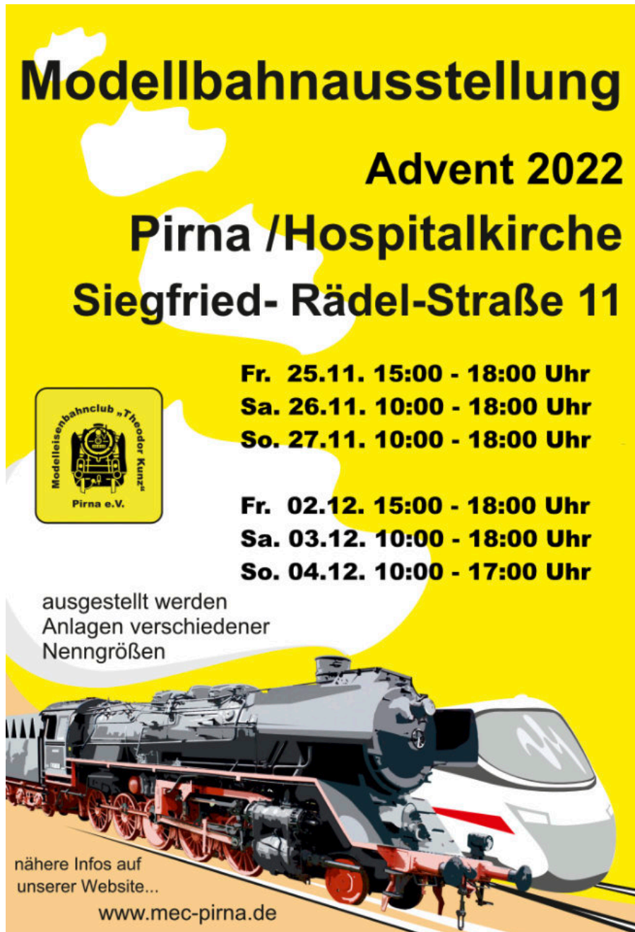
Plakat: MEC „Theodor Kunz“ Pirna e.V.