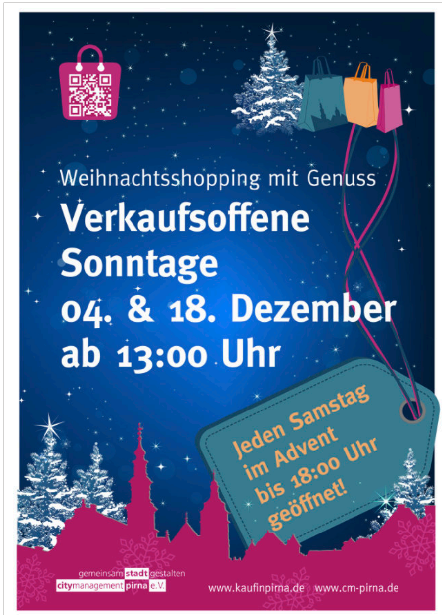
Plakat: Citymanagement Pirna e.V.