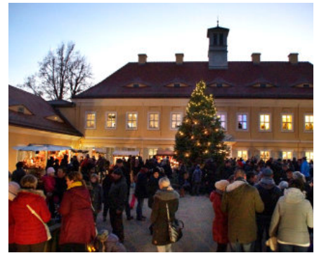
Graupaer SchlossWeihnacht