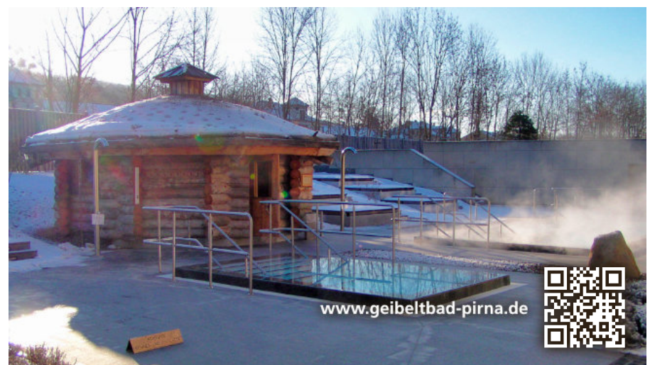
Abbildung: Kultur- und Tourismusgesellschaft Pirna mbH