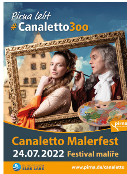
Plakatmotiv zum Canaletto-Malerfest in Pirna

gelverein zum 100. Jubiläumsjahr gratulieren.