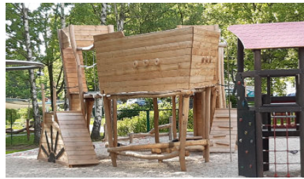
Roller-Parcours und Spielschiff