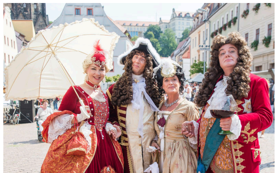
Barockes Treiben in Pirna

Barock-swingendes musikalisches Programm mit Micha Winklers „JazzLust“; Auftritt Hofnarr mit seinem Schweinewagen, Gruppe „Wirbeley“, Hofdamen, Hofmusikanten „Streichholz und Ziehsack“; Porträtzeichnen mit Jo Herz